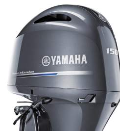
Remote control model (ET)

Ett attraktivt utseende är inte den enda fördelen med den nya motorkåpan. Den är konstruerad för att fånga upp och dränera vatten mycket effektivare, vilket ger smidigare gång, mindre korrosion och längre livslängd för motorn.