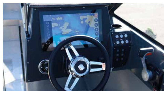
Buster Q 16", hydraulstyrning och tiltratt som standard