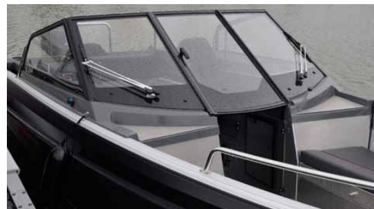
Stilig vindruta skyddar bra mot vind