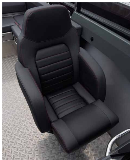
Kraftiga offshorestolar för förare och navigatör